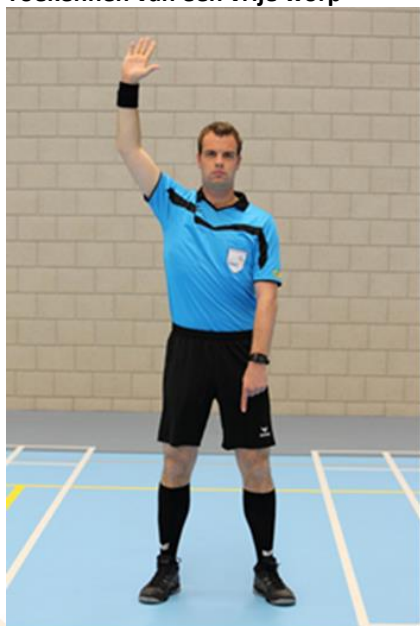
Toekennen van een vrije worp