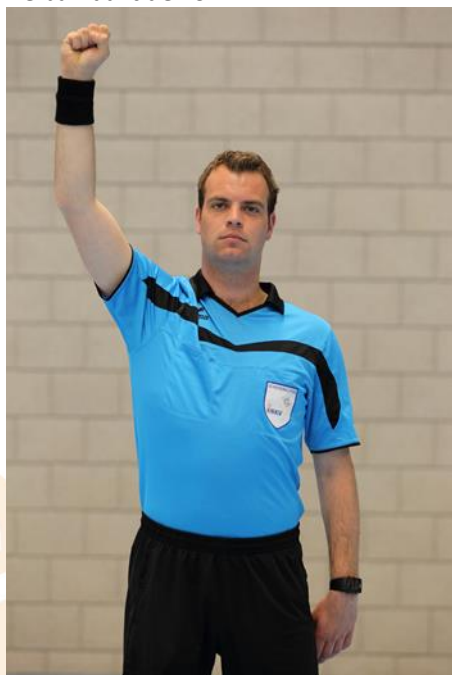
De bal raakt de korf